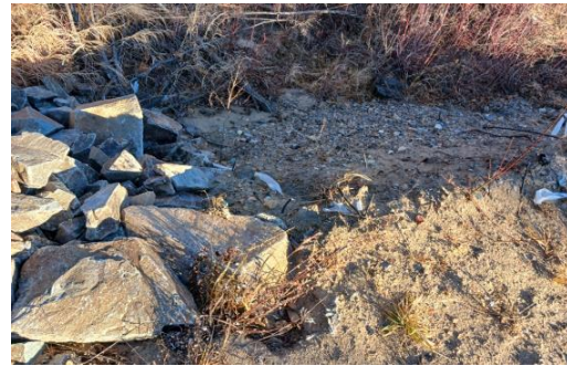
Рис. 3 Насыпь 2 (от участка ул. Веселая, стр. 2 до ул. Солнечная, 32); 08.08.2023: от отметки 708,4 м до 784,3 м – не произведено укрепление мокрого откоса скальным грунтом; 23.10.2023 – дефекты не устранены.