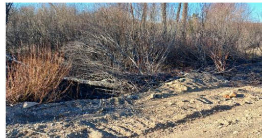
Рис. 4 Насыпь 2 : 08.08.2023: от отметки 691,3 м до 904,1 м – порубочный мусор; 23.10.2023 – убран частично.