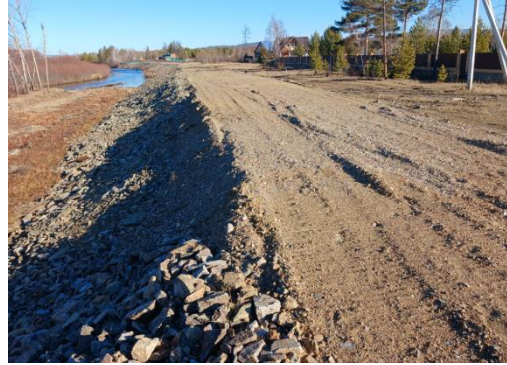
Рис. 2 Насыпь 1 (от участка по ул. Проточная, стр.9 до участка по ул. Казачья, стр. 1); 08.08.2023: отметка 327 м. – трещина, от отметки 327 м до 360,7 м – усадка грунта, от отметки 360,7 м до 371,2 м – провал; 23.10.2023 – дефекты устранены.