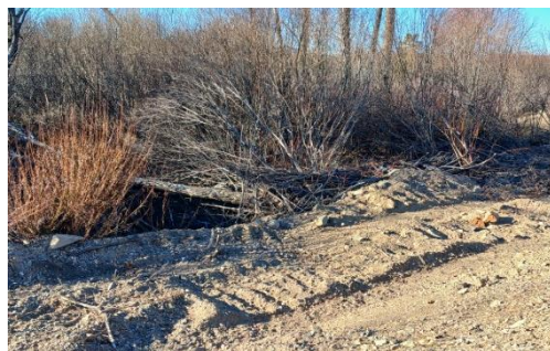
Рис. 5 Насыпь 2: 08.08.2023: от отметки 361,8 м до 491,8 м –вдоль насыпи порубочный мусор; 23.10.2023 – убран частично.